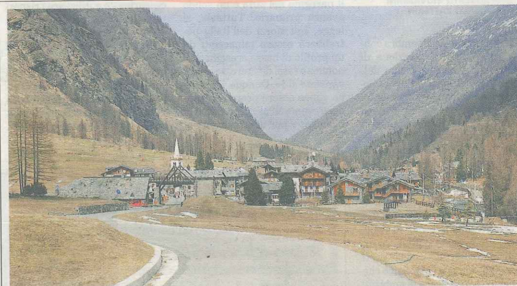
Rheme Notre Dame: assumerà un geometra offrendogli l'ufficio più a valle, a Introd

U n impiego pubblico? Solo se l'ufficio è comodo, meglio ancora se nel capoluogo o sul fondovalle, perché di guidare lungo i tornanti non se ne parla. Alla faccia della crisi e della disoccupazione, nella regione più piccola (e tra le più ricche) d'Italia i sindaci dei paesi di montagna faticano a trovare personale. L'offerta non è da nababbi, ma neppure da buttare: contratto a tempo indeterminato, posto pubblico, 36 ore la settimana, 1500 euro netti di stipendio (compresa l'indennità per la conoscenza della lingua francese, che è di